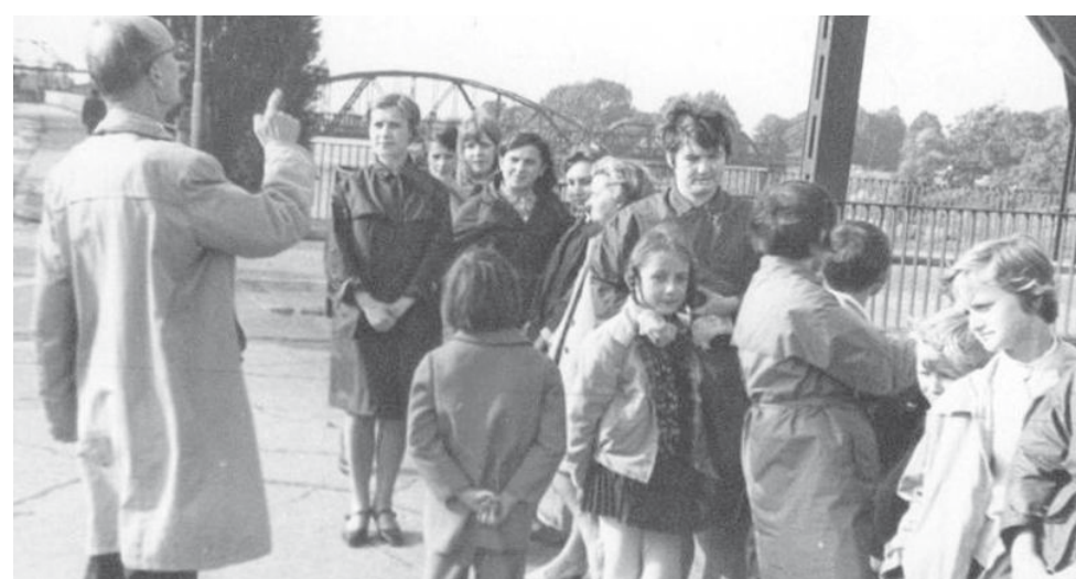
Regionalista oprowadza po Głogowie szkolne wycieczki