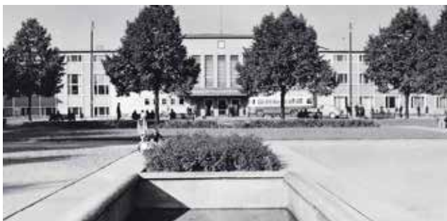
Dworzec kolejowy w 1970 roku

Jeśli mają Państwo pytania lub propozycje dotyczące działu