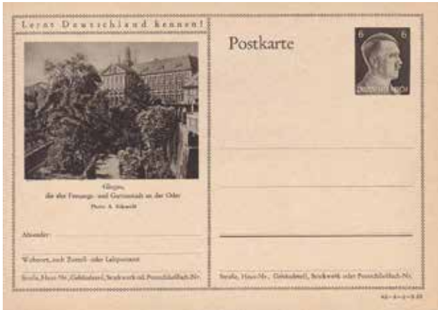
Okolicznościowa kartka pocztowa z czasów III Rzeszy z widokiem głogowskiego sądu

W połowie XIX wieku nowy wynalazek kolei otwierał nową epokę w rozwoju ludzkości. W 1844 roku Dolnośląskie Towarzystwo Kolei Bocznej (Niederschlesische Zweigbahn-Gesellschaft) rozpoczęło pierwsze prace przy budowie infrastruktury kolejowej w rejonie głogowskim a już dwa lata później do Głogowa przyjechał pierwszy pociąg, który kursował na linii Głogów – Jankowa Żagańska. Dzisiejszy dworzec jest już trzecim gmachem kolejowym w Głogowie. Pierwszy dworzec w powstał w okolicach dzisiejszej bocznicy przy ul. Elektrycznej a drugi położony był bardziej na wschód w miejscu dzisiejszego peronu II. W Głogowie przełomu XIX i XX wieku funkcjonowały przedsiębiorstwa znane w całej Europie. Jednym z nich był zakład Carla Weissa, w którym produkowano zegary wieżowe. Jego wyroby zyskały sporą renomę nie tylko na Śląsku, ale też na terenie całej Europy. Efektem tego były wyróżnienia i nagrody na międzynarodowych wystawach oraz liczne zamówienia z całego świata, m.in. z Rosji, Węgier, Turcji, Francji, Australii, Indii i Azji Mniejszej. Natomiast wydawnictwo Carla