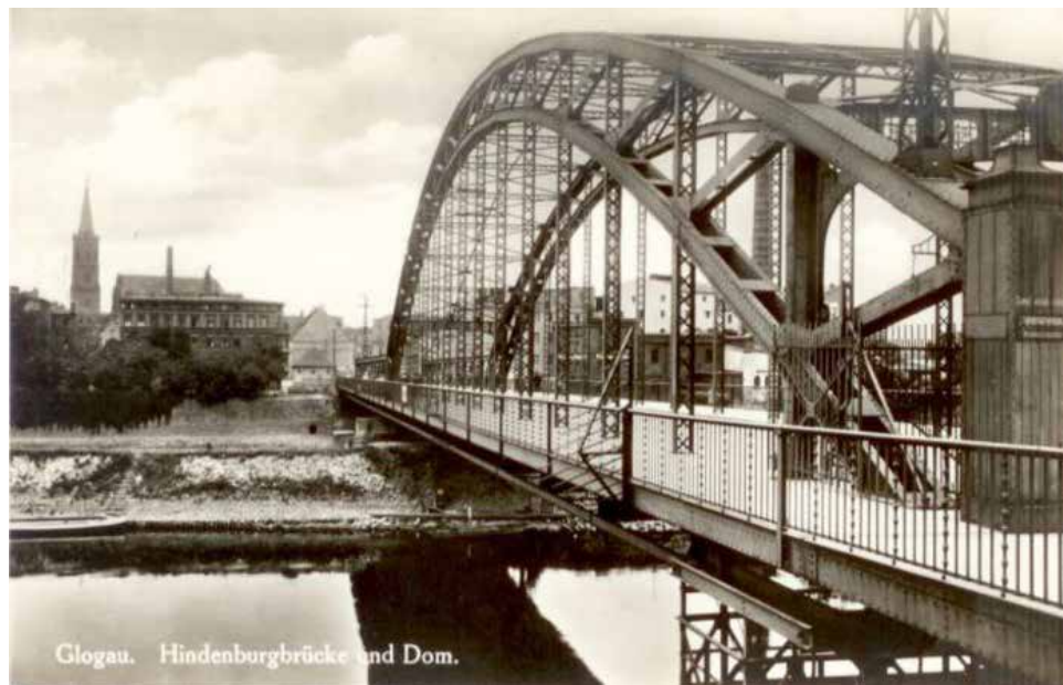
Inne ujęcie mostu Hindenburga, a w tle kolegiata

Głogowa był jednym z największych na Odrze. Most wybudowany był nisko, co miało swoje minusy ale i plusy. Do tych pierwszych należy zaliczyć jego podatność na zniszczenia w czasie powodzi. Plusami natomiast była łatwość jego naprawy bądź rekonstrukcji w przypadku jego całkowitego zniszczenia. W przypadku niesprawnego mostu uruchamiano w Głogowie prom, który łączył oba brzegi miasta. Pierwsze informacje o promie, podobnie jak