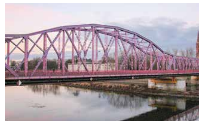
Obecny most drogowy na Odrze w Głogowie