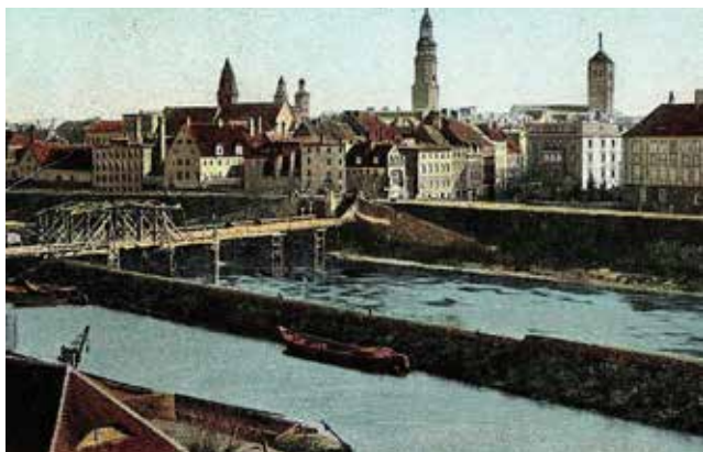
Na tle miasta most drewniany, funkcjonujący w Głogowie do pierwszych lat XX wieku

Pierwsza wzmianka o moście w Głogowie pochodzi z 1291 roku. Pierwszy most był drewniany, jak wszystkie, które wówczas powstawały. Z racji szerokości rzeki, głogowski łącznik obu brzegów