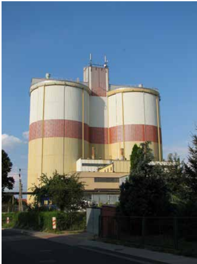
Pozostałe jeszcze silosy cukrowni