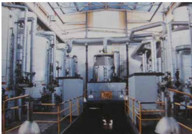
Hala warników w cukrowni

We wrześniu 1997 roku głogowska cukrownia obchodziła podwójny jubileusz: 100-lecia istnienia zakładu oraz 50-lecia jego działalności od ponownego uruchomienia w 1947 roku. Powoli jednak nad zakład napływały czarne chmury. Pod koniec lat dziewięćdziesiątych ubiegłego wieku doszło restruk-