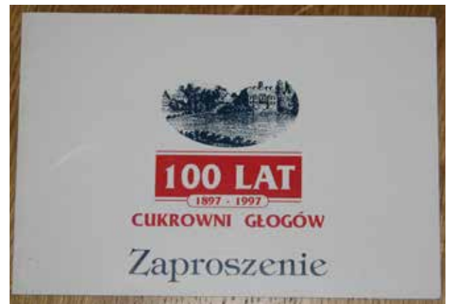
Okolicznościowe zaproszenie na uroczystości 100-lecia Cukrowni Głogów

Siła eksplozji była tak ogromna, że warnik został zerwany, a jego ważąca ponad 30 ton część wystartowała z ogromną prędkością. Ogromny fragment, przebijając dach cukrowni, uniósł się na kilkanaście metrów i spadł 80 metrów dalej, głęboko wbijając się w wybrukowany fabryczny plac.