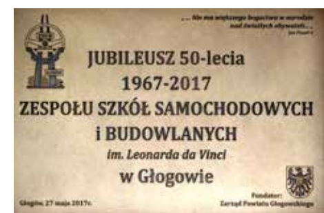
Okolicznościowa tablica, znajdująca się w ZSSiB, ufundowana przez Zarząd Powiatu Głogowskiego

Jeśli mają Państwo pytania lub propozycje dotyczące działu „Historyczne Miasto” Zapraszam do kontaktu! redakcja@glogowextra.pl Dariusz Andrzej Czaja