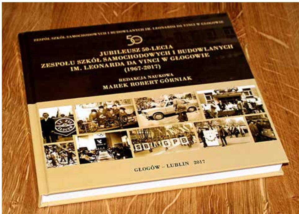
Okładka okolicznościowego opracowania, wydanego z okazji jubileuszu ZSSiB