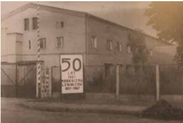
Widok na pierwszą siedzibę szkoły w budynku PKS przy ul. Piastowskiej