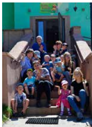
świecna zabawa, która przyniosła korzyści wszystkim uczestnikom.

To był wyjątkowy dzień dla uczniów głogowskiej szkoły i przedszkolaków. Pogoda dopisała więc wszyscy zajęli się ukwiecaniem otoczenia przedszkola. Dzieci przyniosły sadzonki krzewów i kwiatów, a także malin. To była