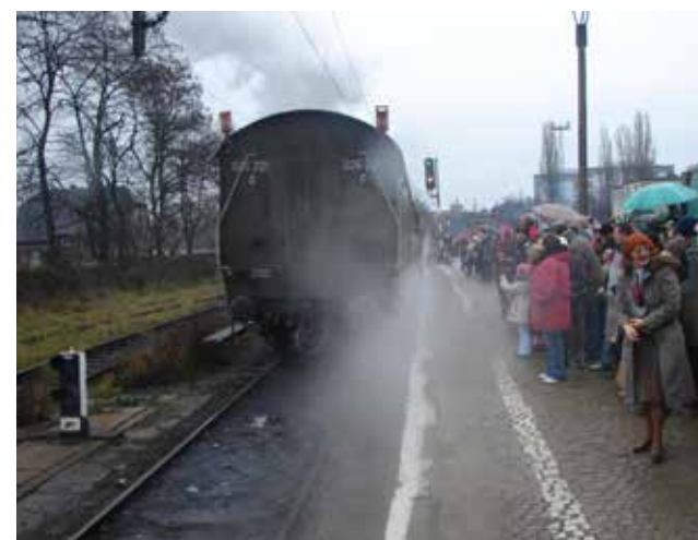
Kolejowy skład odjeżdża w kierunku Leszna

zarówno do Leszna jak i z powrotem. Sam wjazd pociągu na jeden z głogowskich peronów, odbył się już bez takich atrakcji jak 10 lat temu, ale i tak frekwencja wśród mieszkańców naszego miasta dopisała. Pokazuje to, że popularność zabytkowych składów kolejowych rośnie, głównie wśród najmłodszych fanów pociągów.