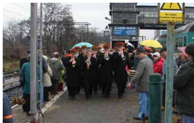
Pociąg z Leszna wita Orkiestra Zakładowa Huty Miedzi Głogów

Jeśli mają Państwo pytania lub propozycje dotyczące działu