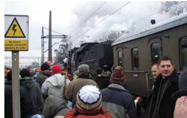
Tłumy głogowian witające pociąg retro (Fot. R.Rokaszewicz)

Niejako więc, przy okazji tegorocznej 160. rocznicy tej trasy, Turystyka Kolejowa – Turkol.pl, przy współpracy Towarzystwa Ziemi Głogowskiej, w celu przypomnienia mieszkańcom miejscowości znajdujących się na tej trasie, zorganizowała okolicznościowy przejazd zabytkowym składem z Wolsztyna. Tym razem uczestnicy wyprawy, po wykupieniu biletów, mieli okazję przejechać się pociągiem retro „Leszczyna”