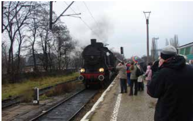
Dekadę temu, w ramach 150-lecia trasy, zabytkowy skład z 1929 roku wjeżdża z Leszna do Głogowa

Z tej okazji, Głogów odwiedził pociąg retro. Podobnie jak 10 lat temu.