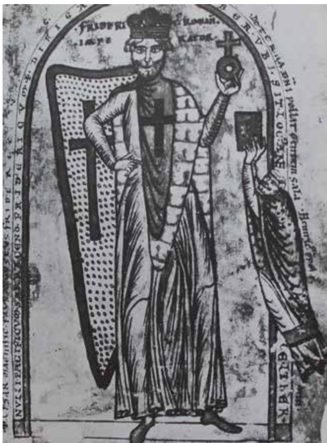
Cesarz Fryderyk Barbarossa jako krzyżowiec (rycina z XII wieku w zasobach Biblioteki Watykańskiej)

Wydarzenie to w dziejach Głogowa jest mało znane. Stąd też warto przybliżyć głogowianom, co działo się 860 lat temu. Latem 1157 roku głogowski gród został zdobyty przez wojska cesarza Fryderyka Barbarossy i tym samym utracił swoje strategiczne znaczenie, z którego słynął do tej pory.