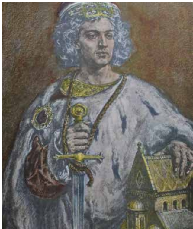
Książę Bolesław Kędzierzawy (wg Jana Matejki)

Do 1157 roku gród głogowski realizował powierzone zadanie obrony granicy zachodniej państwa Piastów. Za przykład niech posłużą tu czasy wojen Chrobrego z cesarstwem, czy też słynna obrona grodu w 1109 roku, kiedy Polską władał Krzywousty. Jednak wydarzenia z połowy XII wieku ukazały polityczną słabość Polski podzielonej na dzielnice między synów tego ostatniego. W wyniku podziału kraju, potomkowie Bolesława doprowadzili do bratobójczej walki. W jej trakcie kasztelan głogowskiego grodu miał spiskować przeciw najstarszemu z rodu Władysławowi, przystając do opozycji, na której czele stał Bolesław Kędzierzawy. Władysław znalazł ostatecznie schronienie na dworze cesarskim i czynił starania do niemieckiej interwencji w Polsce. Udało mu się przekonać dopiero cesarza Fryderyka Barbarossę, którego armia wyruszyła na Polskę 4 sierpnia 1157 roku, przemieszczając się przypuszczalnie starym szlakiem wypraw niemieckich przez Łużycę. Z kolei, mimo pomocy zbrojnej, udzielonej Polsce ze strony Rusi, Połowców, Prusów i Pomorzan, wojska piastowskie nie miały szans w bezpośrednim starciu z Barbarossą.