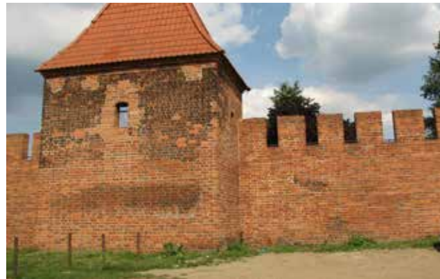
Fragment średniowiecznych murów miejskich

Wraz z lokacją lewobrzeżnego Głogowa w 1253 roku przez księcia Konrada, powstające wówczas miasto otoczone zostało drewnianą palisadą oraz prawdopodobnie umocnieniami drewniano-ziemnymi. Po pożarze Głogowa w 1291 roku i spaleniu się drewnianej osłony, Książę głogowski – Henryk III przyznał miastu środki na