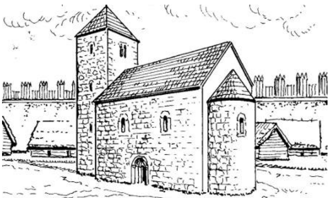
Kościół grodowy a w tle wały XII-w. Głogowa wg Roberta M. Jurgi

W poprzednich wiekach grody a później miasta otoczone były obwarowaniami, które znacznie utrudniały zdobycie ich przez nieprzyjaciela. Umocnienia ewoluowały wraz z rozwojem broni i sposobów zdobywania warowni i twierdz przez wroga, poczynając od pierwszych, nieskomplikowanych nasypów ziemno-glinianych i palisad drewnianych, poprzez kolejne etapy rozbudowy wałów, następnie murów ceglanych a w kolejnych wiekach w urozmaicone i rozbudowane systemy umocnień, często odpornych na ostrzał artyleryjski... Przyjrzyjmy się dziś chociaż w zarysie systemom obronnych stosowanym w dawnym Głogowie.