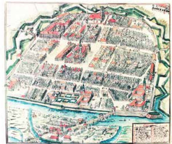
1. Widok Głogowa około roku 1750, rysunek Friedricha B. Wernera

Wraz z rozwojem technologii militarnej, pojawieniem się artylerii oraz zmianą sposobu prowadzenia oblężenia ówczesnych miast, w XVII wieku rozpoczęto w Głogowie budowę bastionowego systemu obronnego. Z końcem tego wieku z krajobrazu ówczesnego miasta zniknęły przestarzałe średniowieczne bramy miejskie. Po 1681 roku rozebrano Bramę Polską. Dziesięć lat później zniknęła Brama Odrzańska. Z kolei Bramę Szpitalną zamknięto z powodu budowy jednego z bastionów („Anioła”). W mieście powstały nowoczesne wówczas bramy obronne: Brama Dworcowa i Brama Wrocławska.