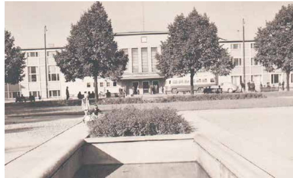
Widok na dworzec z 1970 roku

Według sporządzonej w 1945 roku inwentaryzacji infrastruktury kolejowej w Głogowie oceniono, że zniszczenie budynku dworca kolejowego, wiaduktów: pasażerskiego i towarowego oraz wind bagażowych wynosiło ok. 40%,