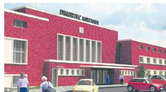
Wizualizacja dworca wg PKP S.A. po planowanym remoncie w 2012 roku

Jeśli mają Państwo pytania lub propozycje dotyczące działu „Historyczne Miasto” Zapraszam do kontaktu!