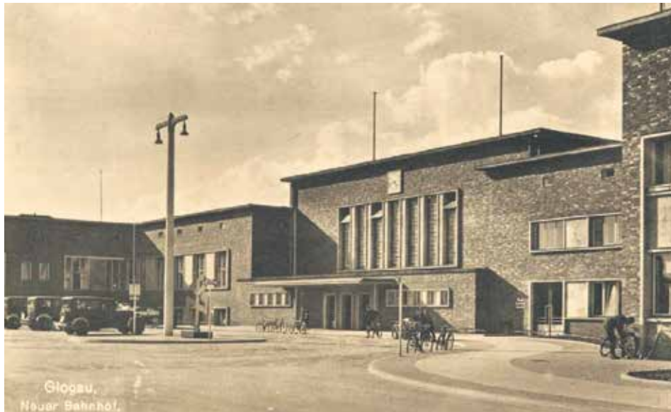
Dworzec kolejowy w latach trzydziestych ubiegłego wieku

Już od 1908 roku władze Głogowa rozpoczęły starania w sprawie modernizacji przestarzałych obiektów kolejowych w mieście. Możliwość realizacji tych planów pojawiła się jednak dopiero w 1932 roku. Wówczas rozpoczęto budowę nowego gmachu dworca kolejowego.