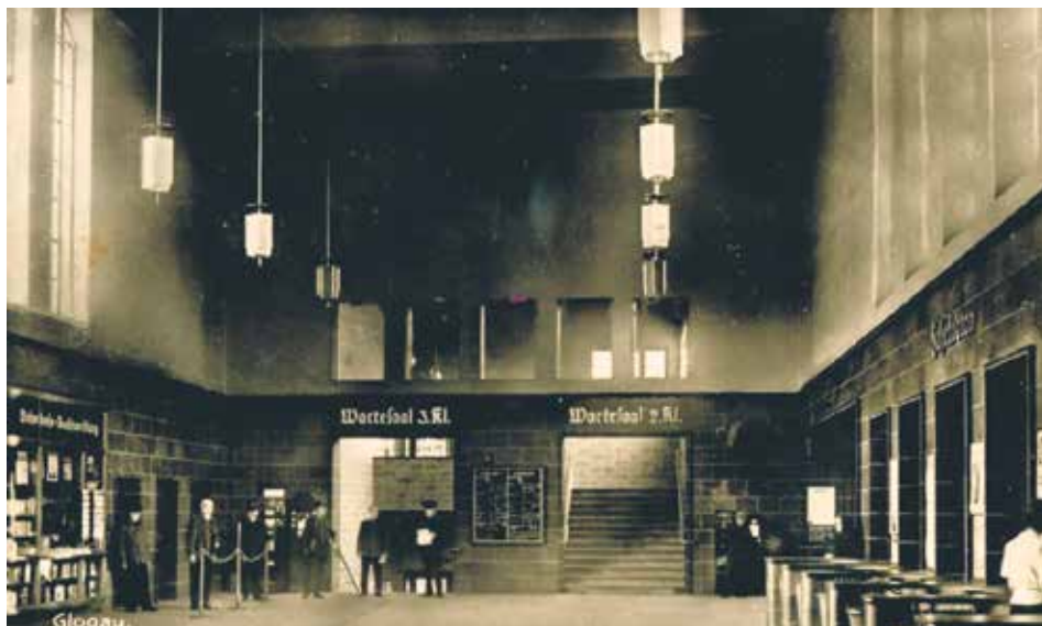
Wnętrze dworca w latach trzydziestych ubiegłego wieku