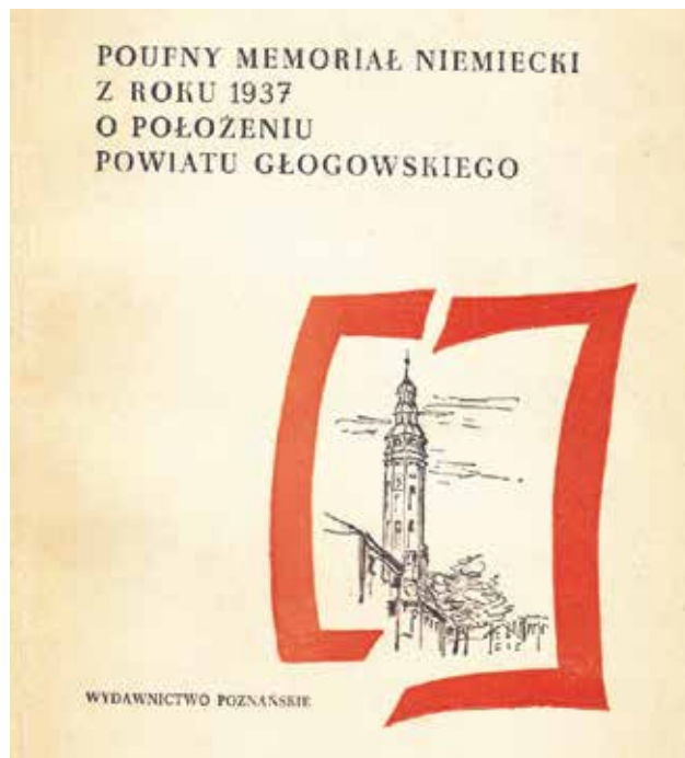
Okladka polskiego wydania poufnego memoriału o położeniu powiatu głogowskiego

Dziś zaprezentowane zostaną dwa opracowania dotyczące ziemi głogowskiej, które łączy to, że są publikacjami, które z perspektywy czasu stały się podsumowaniami ówczesnych epok. Osiem lat przed upadkiem III Rzeszy światło dzienne ujrzał sporządzony przez władze niemieckie memoriał o położeniu powiatu głogowskiego oraz jego problemach i trudnościach. Podobnie było w przypadku statystycznego opracowania podsumowującego Głogów w 40-lecie Polski Ludowej, które zostało opracowane dokładnie cztery lata przed zakończeniem socjalizmu w Polsce. O czym były oba opracowania? Co ciekawego zawierały? Odpowiedzi na te pytania znajda Państwo już poniżej.