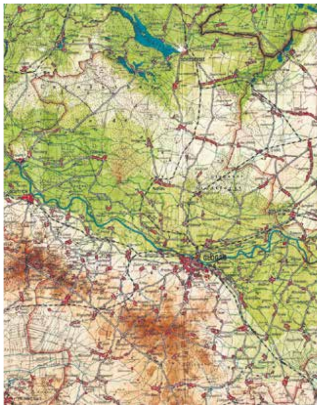
Powiat głogowski w przededniu rozpoczęcia II wojny światowej

przyznawali na jego łamach, że problemy ziemi głogowskiej nie różnią się zbyt wiele od tego, z czym borykały się inne powiaty na ówczesnych niemieckich kresach. Przeraziła jednak ich skala. Do głównych negatywnych zjawisk zaliczano tzw. Ostflucht czyli zjawisko masowej ucieczki Niemców z terenów wschodnich Niemiec. Struktura gospodarcza powiatu była typowo rolnicza, a mając ograniczone możliwości