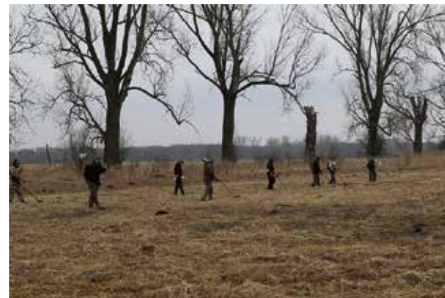
Eksploratorzy w poszukiwaniu śladów żołnierzy z Festung Glogau w okolicach Przemkowa