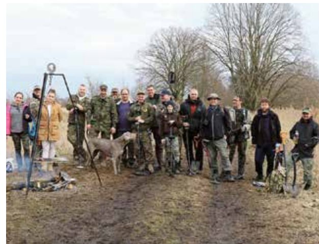
Działania w terenie to nie tylko poszukiwania ale i czas na integrację

Jeśli mają Państwo pytania lub propozycje dotyczące działu